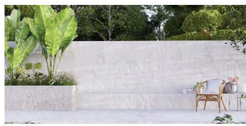
รั้วที่ทำด้วย โครงสร้างคอนกรีต

โครงสร้างกำแพงที่ เหมาะสมสำหรับการติดตั้ง