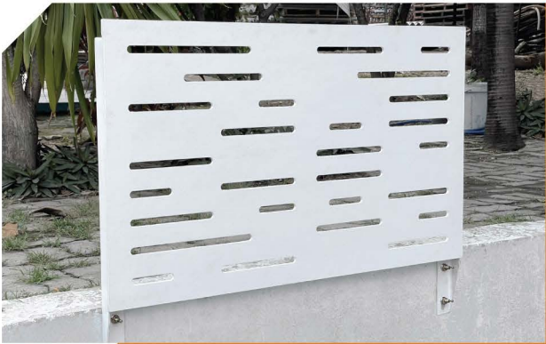
ไม้ระแนงบังตาสำเร็จรูปพร้อมโครงสร้างเหล็ก