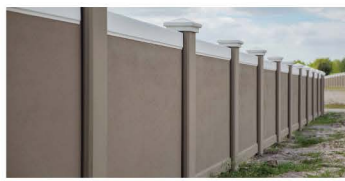
รั้วที่ทำด้วย โครงสร้างคอนกรีตสำเร็จ PRECAST (พรีคาสท์)