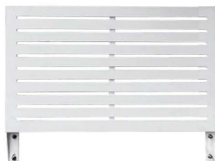
ขนาด D5xW100XH75.5 cm น้ำหนัก 13.5 Kg / ชิ้น

ไม้ระแนงบังตาสำเร็จรูปปลายตรงสีขาว ติดตั้งพร้อมแผ่นบอร์ดเนื้ออะลูมิเนียมขนาด 8 มม สีสำเร็จ คู่กับโครงเหล็กทำสีขาว