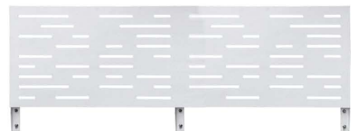
ขนาด D5xW200XH75.5 cm น้ำหนัก 24.5 Kg / ชิ้น