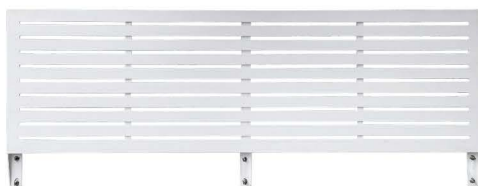
ขนาด D5xW200XH75.5 cm น้ำหนัก 24.5 Kg / ชิ้น