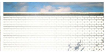
รั้วที่ทำด้วย โครงสร้างอิฐมวลเบา

หมายเหตุ : ไม่แนะนำให้ติดตั้งบนรั้วที่ทำด้วยอิฐมวลเบา หรืออิฐบล็อก