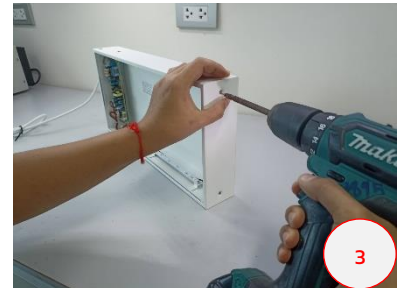
ขันสกรูฝาข้างด้านบนออก