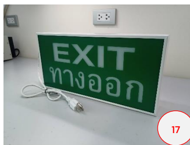
ปิดสวิตช์ OFF ที่ตัวเครื่องเพื่อปิด การทำงานของตัวเครื่อง และสิ้นสุด การประกอบแผ่นป้าย