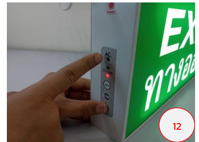
ทดสอบกดสวิตช์ TEST แสงสว่าง ป้ายต้องสว่างต่อเนื่องเช่นกัน