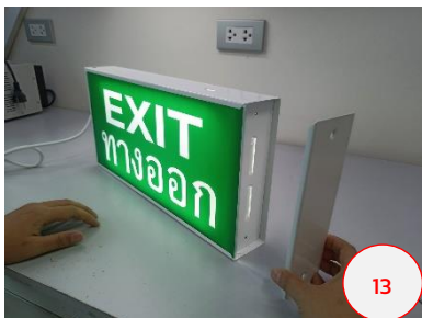
ประกอบยึดฝาข้าง