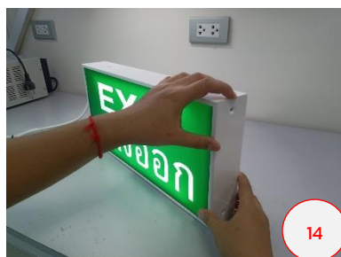
ต้องให้ฝาข้างประกอบกันอย่าง สมบูรณ์