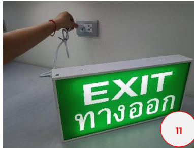
เสียบปลั๊กไฟตัวเครื่อง แสงสว่าง ต้องสว่างต่อเนื่อง