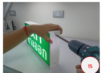
ขันยึดสกรูตัวบนให้แน่น