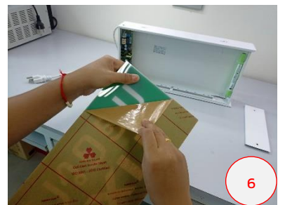
ลอกแผ่นกันรอยแผ่นป้ายออก