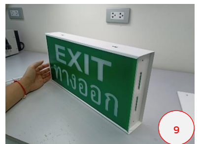
ประกอบป้ายเข้าตัวเครื่องให้ เรียบร้อย