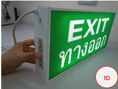
กดสวิตช์ ON หลอดไฟจะสว่าง