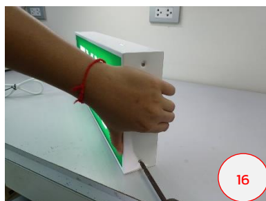
ขันยึดสกรูตัวล่างให้แน่น