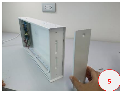
นำฝาข้างออก