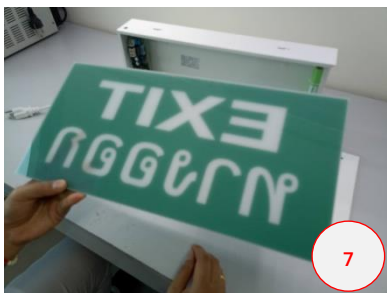
ลอกแผ่นกันรอยให้หมด