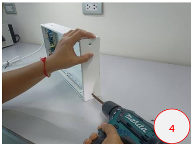
ขันสกรูฝาข้างตัวล่างออก