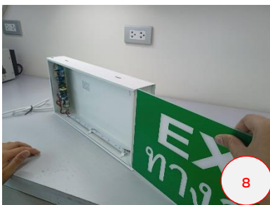
ประกอบแผ่นป้ายเข้ากับตัวเครื่อง