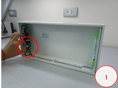
ประกอบคอนเนคเตอร์แบตเตอรี่