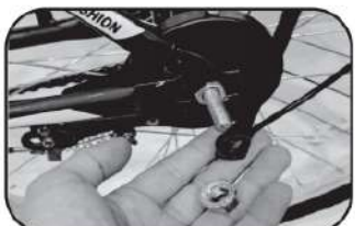
25. ถอดนอตล้อหลังออก