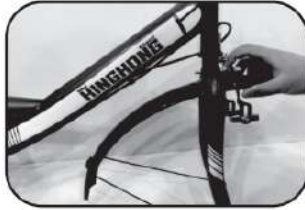
3. ร้อยนอตเพื่อประกอบบังโคลนหน้าและขาบิด