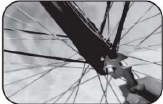
7. ประกอบขาบิดบังโคลน ขาบิดตะกร้า และชันนอตล้อหน้าให้แน่น