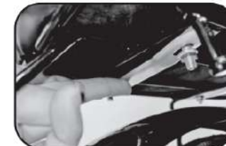
24. ประกอบเบาะเสริมท้าย