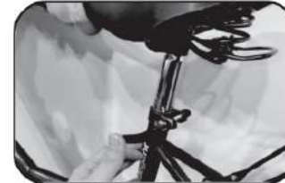
11. ปรับที่นั่งให้อยู่ในตำแหน่งที่เหมาะสมและชันให้แน่น