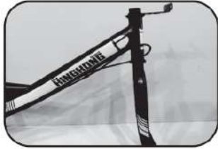
2. หมุนตะเกียบล้อหน้าให้หันมาด้านหน้า