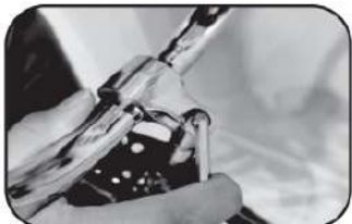
13. ชันนอตให้แน่น