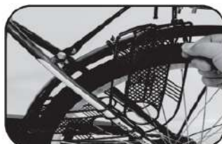
28. ติดตั้งตาข่ายป้องกันล้อหลัง