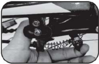
20. บีบเบรกหลัง ชันสายเบรกและนอตให้แน่น