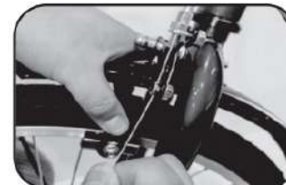
18. บีบเบรกหน้า ชันสายเบรกให้แน่น