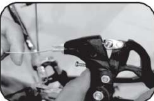
15. ใส่สายเบรกเข้าไปในก้านเบรก