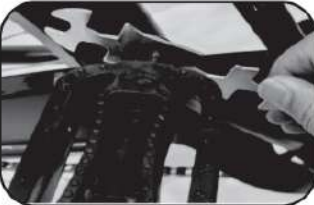
9. ชันบันไดให้แน่นทั้งสองด้าน