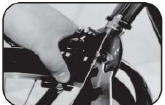
19. บีบสายเบรกหน้าและชันนอตสายเบรกให้แน่น