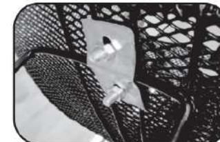
23. ชันนอตด้านนอกที่ด้านล่างของตะกร้าให้แน่น