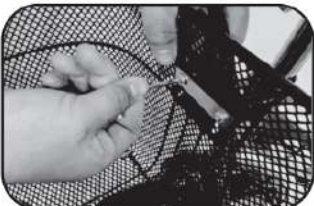
21. ชันนอตให้แน่นที่ด้านบนของตะกร้า