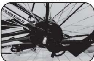
26. ติดตั้งขาตั้งจักรยาน