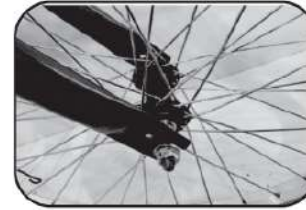
5. ถอดนอตล้อหน้าออก