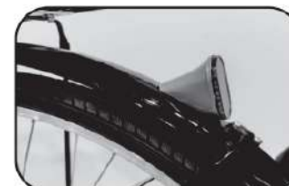
29. ติดตั้งทับทิมสะท้อนแสงที่บังโคลนหลัง