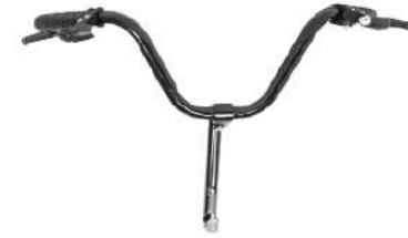
2. แฮนด์จักรยาน & คอแฮนด์