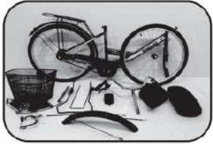
1. ส่วนประกอบที่ใช้ประกอบเข้ากับโครงจักรยานหลัก