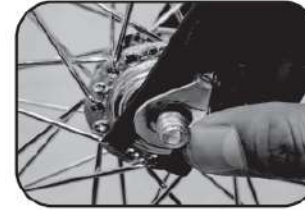
6. ประกอบแหวนรองล้อหน้า