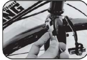
4. ปรับระดับให้เข้าที่ ชันนอตให้แน่น