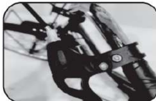
16. ประกอบสายเบรกให้เข้าที่ตามมือเบรก