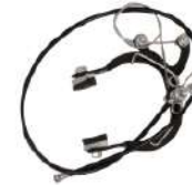
7. เบรคหน้าพร้อมสายเบรค