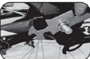
27. ชันนอตให้แน่น