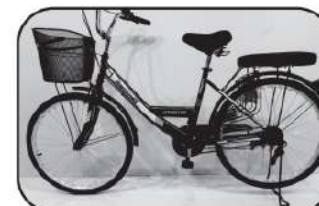
30. ติดตั้งเสร็จเรียบร้อย

We are not just manufacturing the bike, but also creating the colorful and passion life for you.