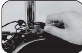
10. ประกอบอานและหลักอานให้เข้ากับโครงรถ และชันนอตให้แน่น