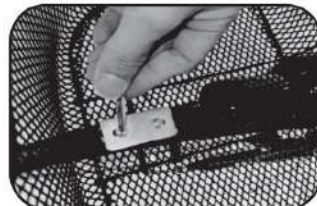
22. ชันนอตให้แน่นที่ด้านล่างของตะกร้า