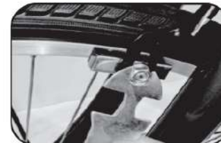
17. ปรับผ้าเบรกให้เป็นแนวอนหรือ 90°