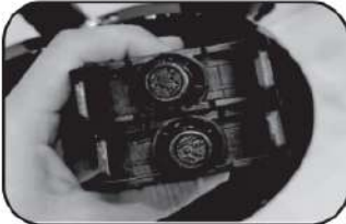
8. ประกอบบันได โดยสังเกตเครื่องหมายที่ระบุข้างชาย/ขวาให้ถูกต้อง