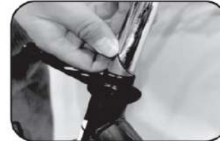
12. ประกอบแฮนด์จักรยานเข้ากับโครงรถ