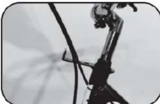
14. จากนั้นร้อยสายเบรกเข้าไปในช่องขาบิดตะกร้า