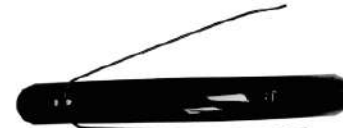
6. บังโคลน & ขายึดบังโคลน