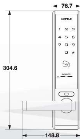
External Module โมดูลด้านนอกห้อง